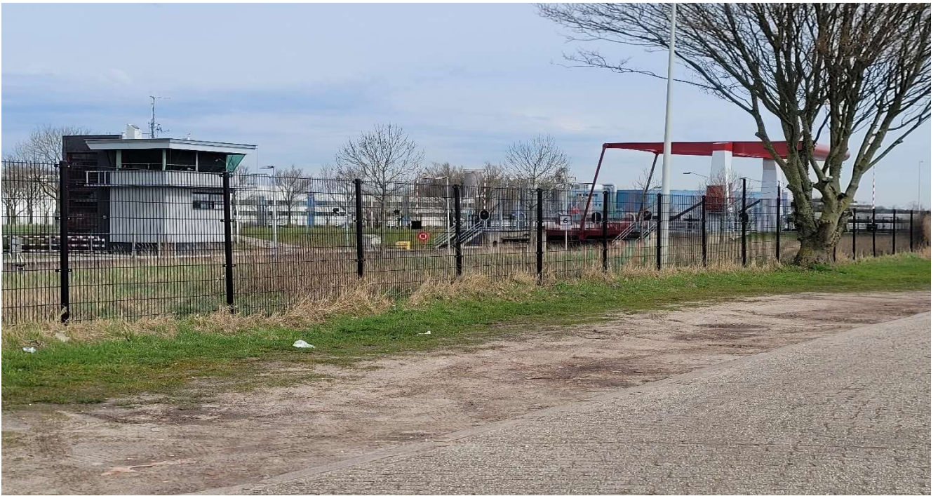
Het kantoor van de havendienst in het bedieningsgebouw boven op de Burgemeester Petrussluis.